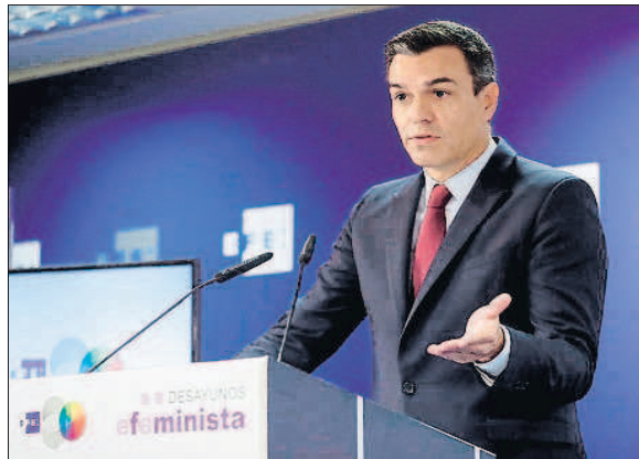
Pedro Sánchez, presidente en funciones, en unas jornadas ayer en Madrid

Desde la patronal CEOE, plantean que no es cierto que las grandes compañías españolas paguen menos tributos que las europeas. Entre sus argumentos sobresale, con datos de Eurostat del 2016, que en España de cada 100 euros recaudados, 31,6 euros provienen del sector empresarial; mientras que en la Unión Europea, de media son 23,5 euros de cada 100. Además, recuerdan que "limitar al 95% la actual exención del 100% de los dividendos para corregir la doble imposición es per-