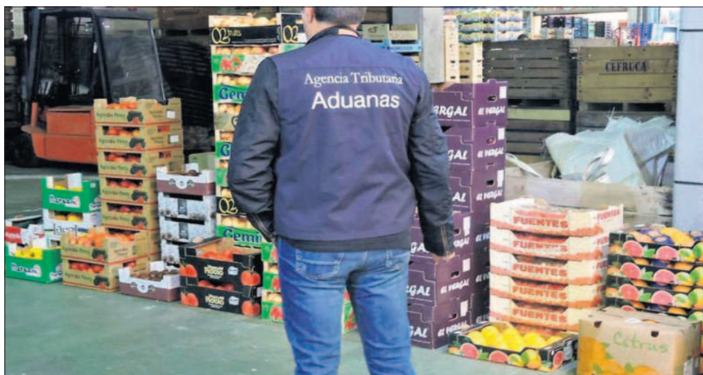
Un funcionario de la Agencia Tributaria durante uno de los registros en los mercados de la Operación Carpo, el pasado octubre.