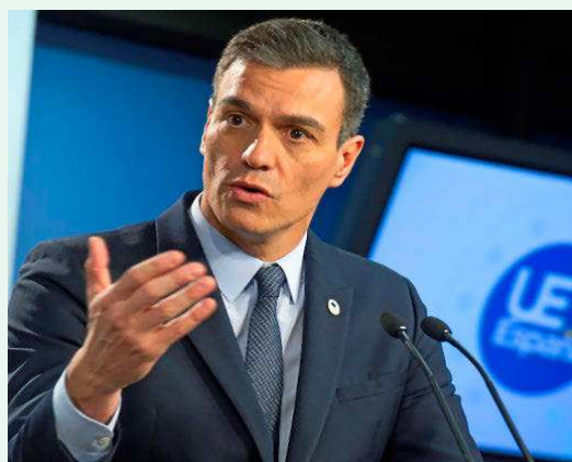
Pedro Sánchez, presidente del Gobierno.