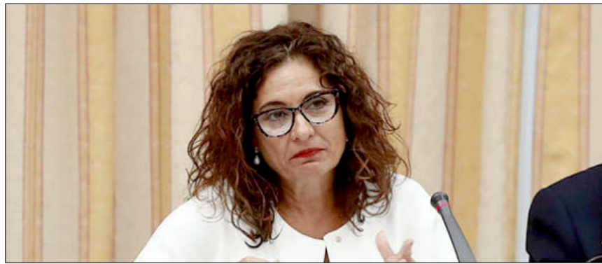
María Jesús Montero, ministra de Hacienda.

Recuerda que “si nos atenemos a esta figura exclusivamente, el Impuesto de Patrimonio estuvo