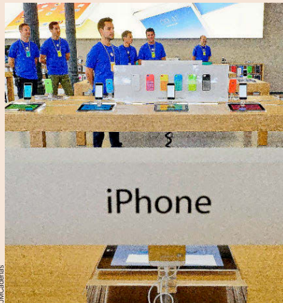
APPLE Una de las filiales en España de la compañía que dirige Tim Cook, Apple Retail Spain, pagó 11,7 millones de euros en el año 2016 en concepto de Impuesto sobre Sociedades, frente a los 3,3 millones de euros que abonó a la Hacienda española en el ejercicio anterior.