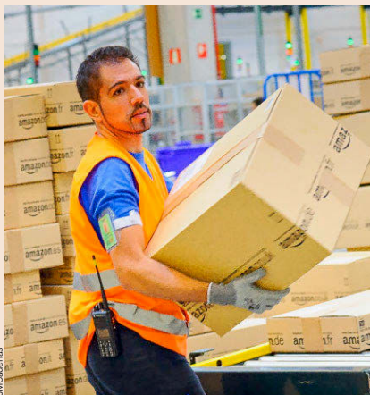
AMAZON El gigante del comercio electrónico tiene cuatro filiales en España y pagó 2,9 millones en Impuesto sobre Sociedades en 2016, más de 10 veces que un año antes. La sociedad principal, Amazon Services, pagó 1,95 millones en Sociedades frente a 135.739 euros en el ejercicio anterior.