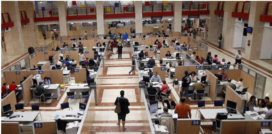
Vista de la delegación de Hacienda de Guzmán el Bueno, en Madrid.