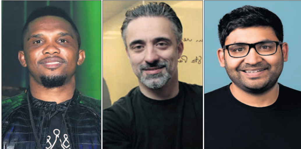
Desde la izquierda, el exfutbolista Samuel Eto'o, el cocinero Sergi Arola y el director ejecutivo de Twitter, Parag Agrawal.