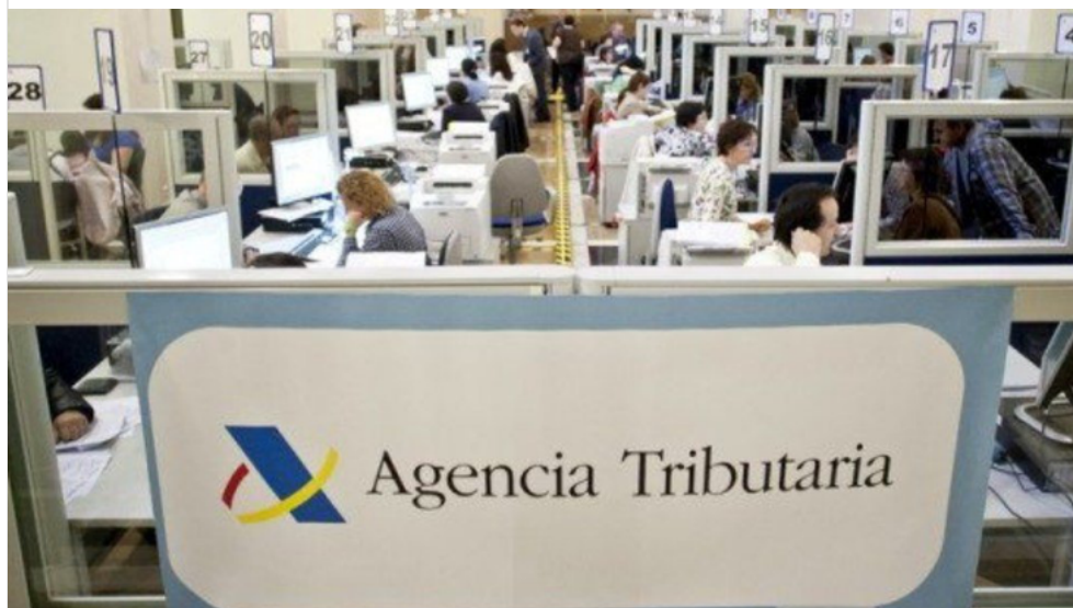
Sede de la Agencia Tributaria

Hacienda suele levantar actas medias de 100.000 euros en el 70% de las visitas sorpresa que realiza a los autónomos y empresas, según el subinspector de la inspección.