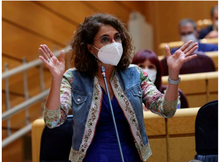
La ministra de Hacienda, María Jesús Montero, en el Senado.

El acuerdo alcanzado por PSOE y Podemos implica recuperar el tipo mínimo que se incluyó en los PGE de 2019 que tumbó el Congreso, esto es, se aplicará sobre la base imponible