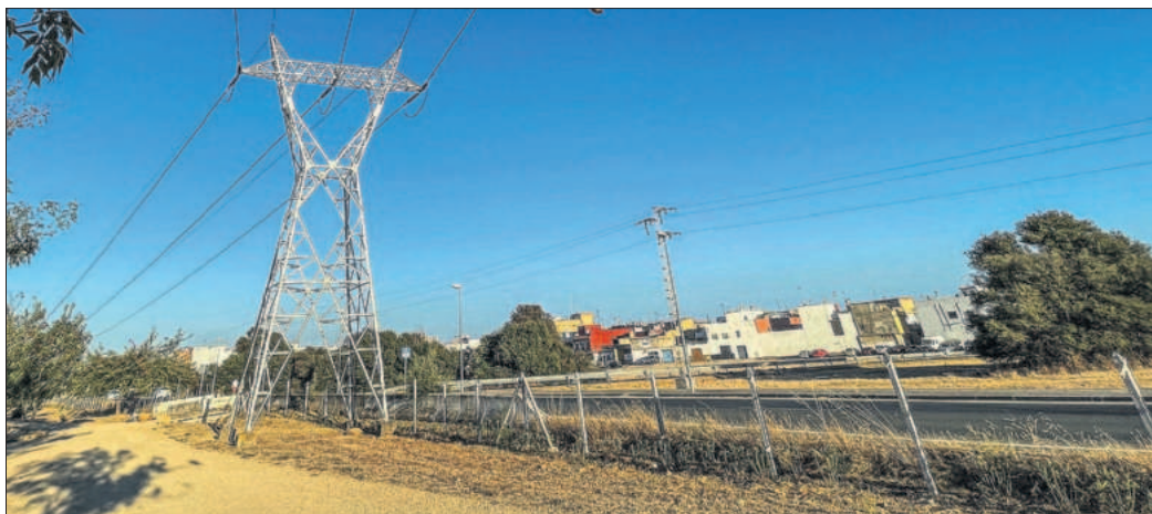
Torres de un tendido eléctrico en el barrio de Torreblanca en Sevilla.