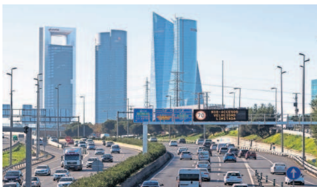
El transporte es uno de los sectores con margen de mejora impositiva.

económicos y sociales, serán mayores”, avisa.