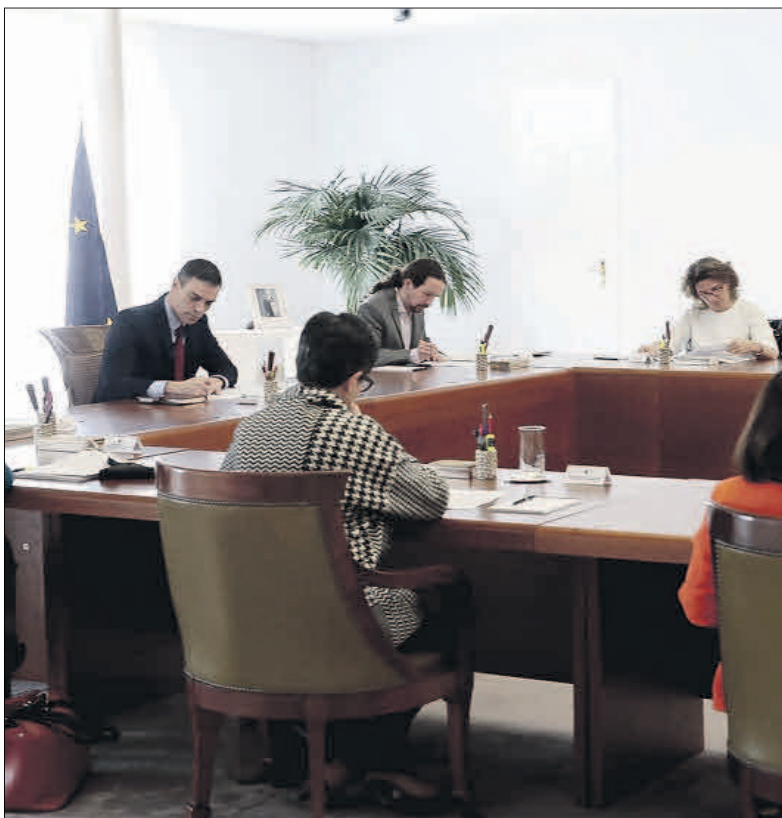
Vista parcial del Consejo de Ministros, presidido por Pedro Sánchez.