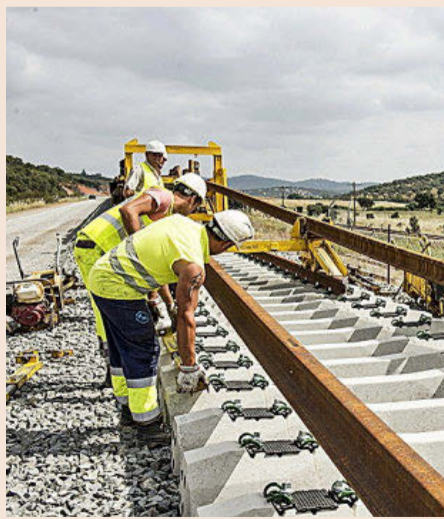
El tren copará el 41% de la inversión.

realicen actuaciones inversoras en materia de transportes, como Adif, que percibirá 675 millones de euros, Adif-Alta Velocidad (1.285 millones) o Seittsa, dedicada a las carreteras (154 millones), mientras que otras se destinarán a Enaire (29 millones), Renfe Viajeros (13 millones) o Puertos del Estado, 140 millones de euros. Por áreas de actuación, las obras en carreteras concentrarán un gasto de 989 millones de euros, junto con otros 1.033 millones para la conservación viaria. Tras el ferrocarril, las mayores partidas de gasto irán para las infraestructuras de puertos, 1.003 millones, aeropuertos, 1.059 millones, la Hidráulica, 766 millones, y la de Costas y Medioambientales, 229 millones.