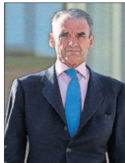
El futbolista Neymar, la actriz Paz Vega y el exbanquero Mario Conde.