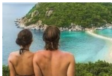
No se lo esperaban... Hicieron el viaje de sus sueños con el descuento de esta curiosa web