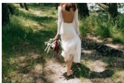
No se lo esperaba... Estaba apunto de casarse y descubrió esta curiosa noticia