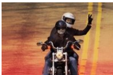
¿Por qué el saludo en V? El por qué del mítico saludo entre moteros. Esta es la explicación....