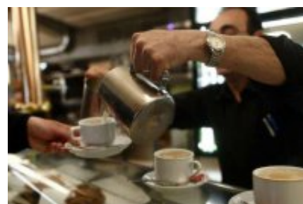
El otro rompecabezas de la hostelería catalana