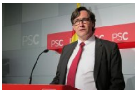
El PSC pide la dimisión de Junqueras por la fuga de empresas