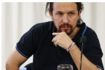
Pablo Iglesias, abucheado por manifestantes en Barcelona