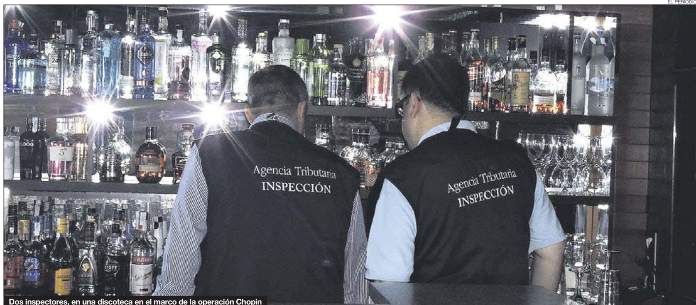
Dos inspectores, en una discoteca en el marco de la operación Chopin